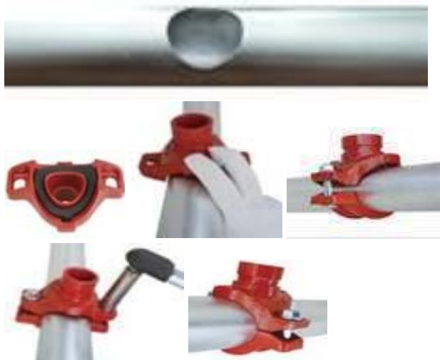
Рис.3. Установка отвода (седелка) под муфту на трубопровод.